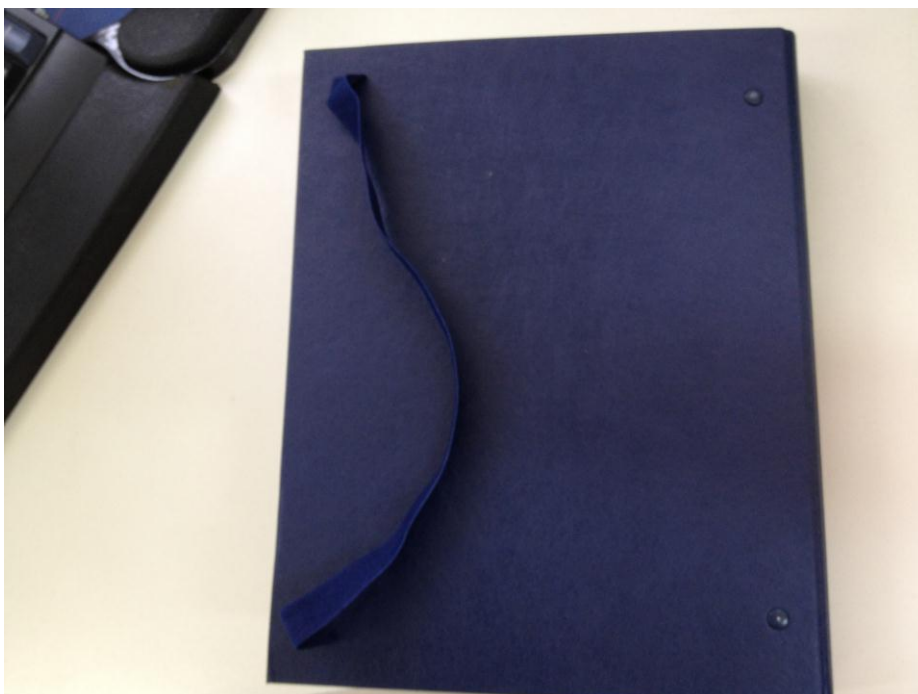
Capa com elástico (verso)