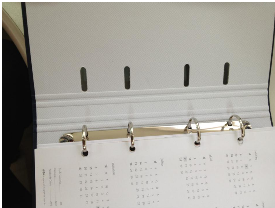
Argolas, furação e acabamento das dobras internas (2)