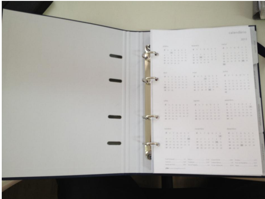
Argolas, furação e acabamento das dobras internas (1)

Rua Capote Valente, 487 – Jardim América - CEP 05409-001 – São Paulo – SP Fone (0..11) 3067-1450 – Fax (0..11) 3064-8973 – Home Page: http://www.crfsp.org.br