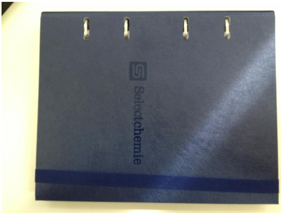
Capa com elástico (frente)