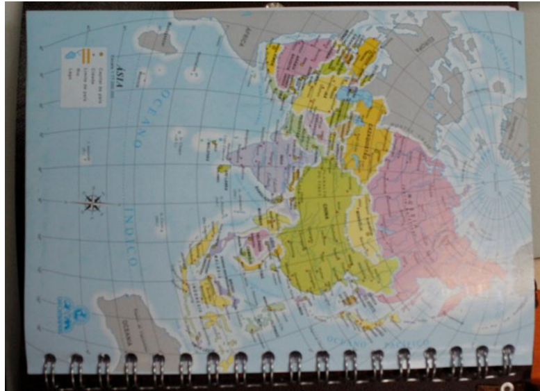
Mapa da Ásia