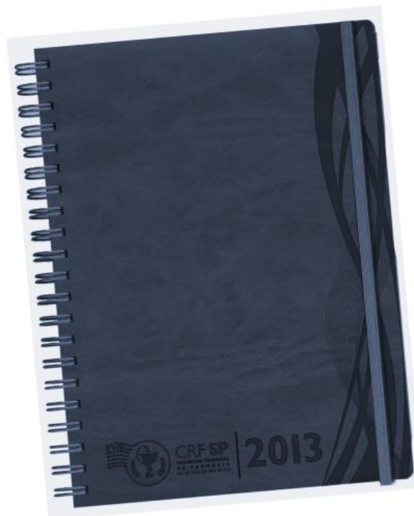
Arte da capa (meramente ilustrativa, podendo sofrer modificações posteriores)