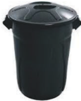
FOTO REFERÊNCIA DAS LIXEIRAS PARA LIXO INFECTANTE COM SEUS DEVIDOS SACOS DESCARTÁVEIS NA COR BRANCA (ITEM 2.3.2)