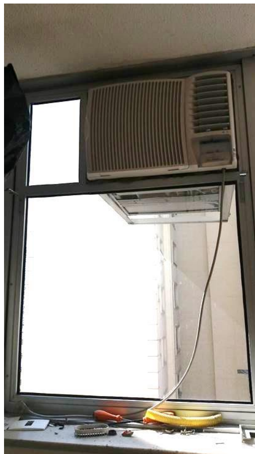
Modelo de módulo de caixilho fixo com suporte para equipamento de ar condicionado