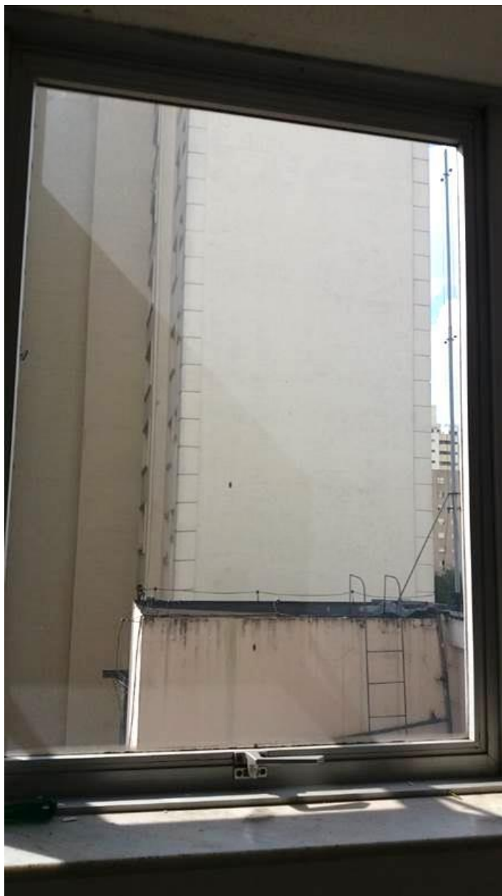
Modelo de módulo Basculante Existente

Rua Capote Valente, 487 – Jardim América - CEP 05409-001 – São Paulo – SP Fone (0..11) 3067-1450 – Fax (0..11) 3064-8973 – Home Page: http://www.crfsp.org.br